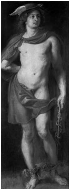
Hermes, el dios protector de los hemeródromos.

Los atenienses comprendieron que realmente Pan había luchado a su lado. Así que después de la batalla de Maratón no volvieron a olvidarse del dios Pan. Por expreso consejo de Milcíades, le dedicaron un santuario en una gruta de la Acrópolis ateniense, y cada año le ofrecían sacrificios y realizaban una procesión de antorchas en su honor.