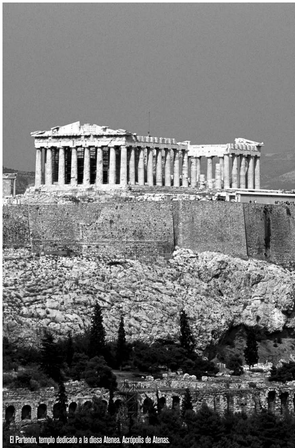
El Partenón, templo dedicado a la diosa Atenea. Acrópolis de Atenas.