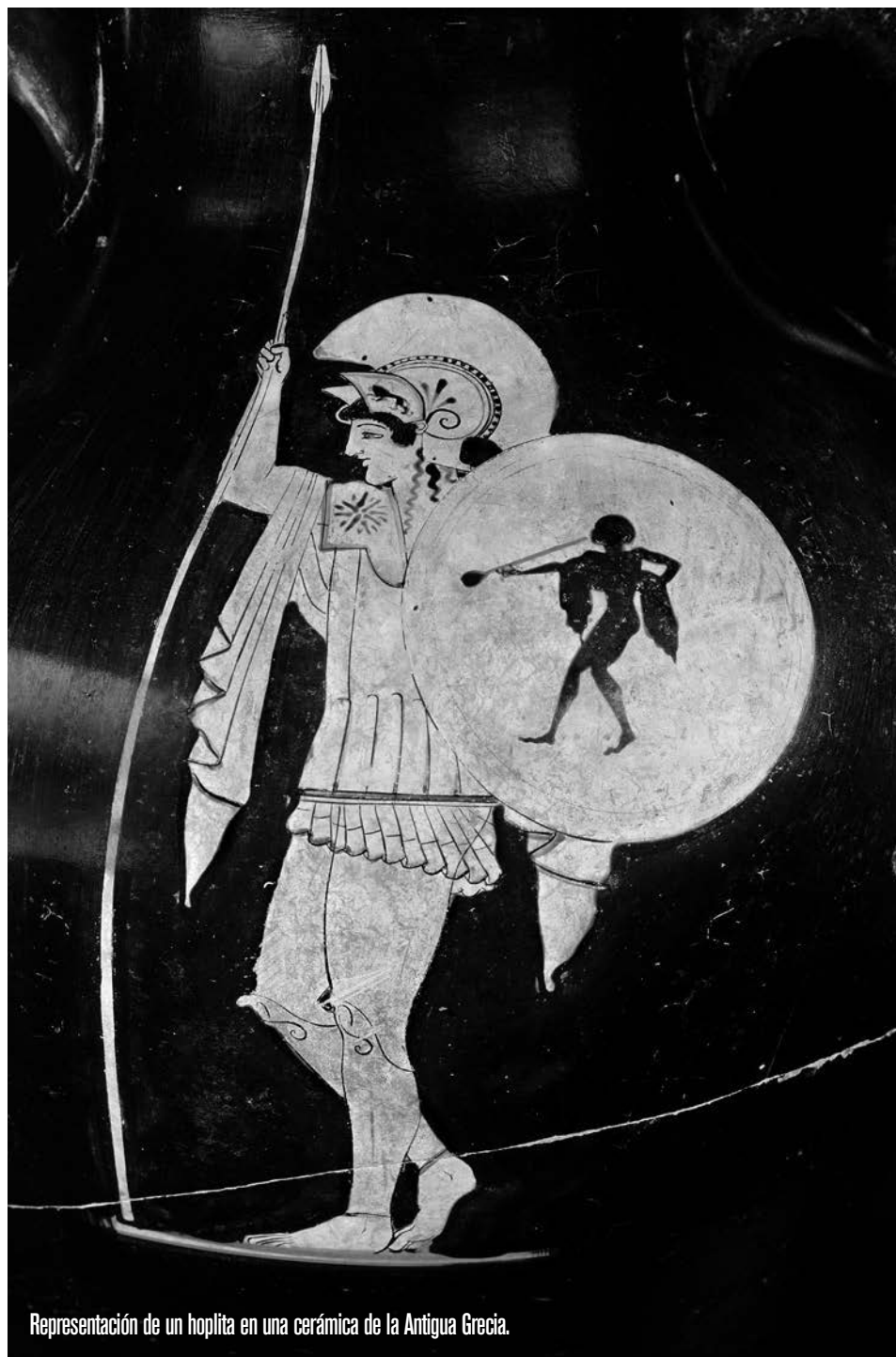
Representación de un hoplita en una cerámica de la Antigua Grecia.