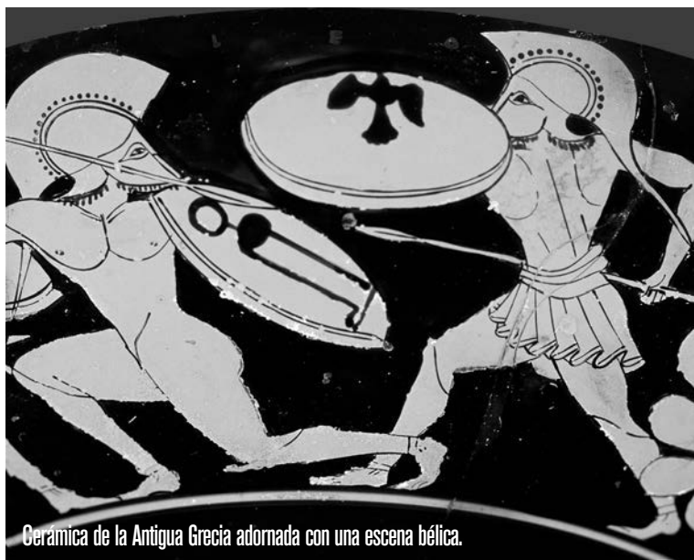
Cerámica de la Antigua Grecia adornada con una escena bélica.

En la educación que recibían los niños atenienses, y nos referimos solo a los varones hijos de ciudadanos libres, era tan importante el cuidado de la mente como el del cuerpo. A los siete años empezaban en la escuela, donde les enseñaban lectura, escritura, matemáticas y música. A los doce años empezaban a asistir al gimnasio, donde entrenaban intensamente y practicaban sobre todo la lucha, las carreras, el salto, el lanzamiento de disco y el de jabalina, todas ellas disciplinas olímpicas que permitían adquirir habilidades útiles para la batalla. A los dieciocho años ya podían convertirse en ciudadanos y soldados, es decir, en hoplitas. Cada hoplita