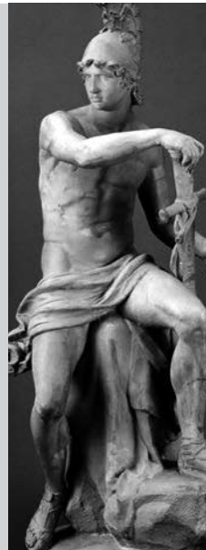
Ares, el dios de la guerra.