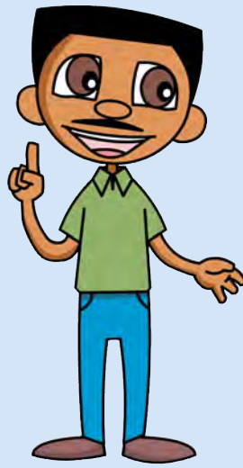
Padre y madre de Manu