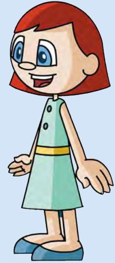
Padre y madre de Felipe y Anita